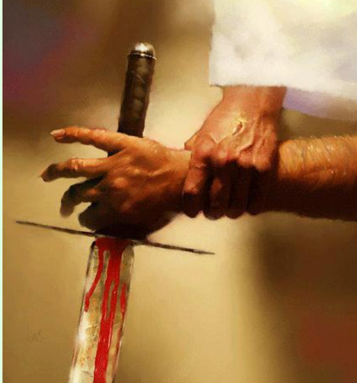
Una guerra con Roma sólo podía desembocar en una gigantesca matanza del pueblo.

Por lo general, la gente había visto en Jesús a un profeta semejante a Juan el Bautista, Elías, Jeremías o cualquier otro profeta (Mc 8, 28, pars.). Pero ahora Pedro, en nombre de los demás discípulos, afirma que considera a Jesús el Mesías (Mc 8, 29, pars.). Jesús le replica con la orden estricta de no decir nada de eso a nadie (Mc 8,