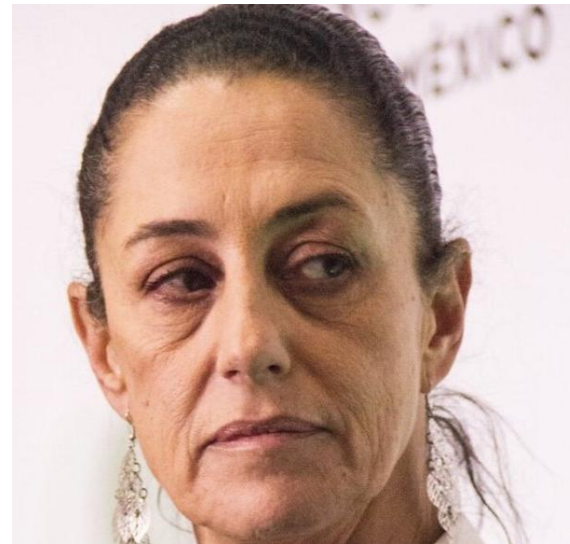
Engaños y traiciones

¿Cómo una persona corrupta, que engaña y traiciona continuamente, que humilla e impone su voluntad, que golpea políticamente a un ciudadano, se atreve a hablar en contra del machismo? Tiene libertad para hacerlo, pero no vergüenza. Carece de calidad moral al solapar los machismos en su partido, como los del autoritario López Obrador, o del "violador" Cuauhtémoc Blanco, o de Félix Salgado, o del "rey" Fernández Noroña, o de la gobernadora Layda Sansores y los de un sinnúmero de políticos tan machistas como ella, incluidas muchas mujeres. Ahí no dice nada. Y ahora liberan a Israel Vallarta, acusado de secuestrador y violador, con el apoyo de una jueza del acordeón... interesante .