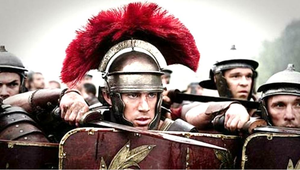
Jesús no era un pacifista, pero veía que una guerra con Roma sólo podía desembocar en una gigantesca matanza del pueblo.

temáticas, se incluyó entre las otras tentaciones que padeció durante los 40 días en el desierto (Lc 4, 5-8; Mt 4, 8-10). Se nos da a entender que Jesús tuvo que luchar contra esta tentación de tomar el poder, aceptar el trono y gobernar un nuevo imperio («todos los reinos del mundo»). ¿Acaso no sería esta la mejor manera de liberar a los pobres y a los oprimidos? ¿No podría ejercer la autoridad como un servicio a todos los hombres, una vez que hubiera tomado el poder por la fuerza? ¿No sería un modo más eficaz de suscitar la fe y cambiar el mundo?