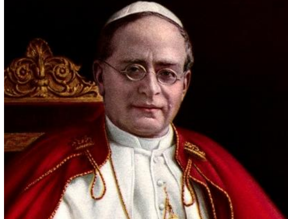
Papa Pío XI (1857-1939)

Esto fue repetido por el Papa Pío XI en su encíclica Quadragesimo Anno: “El inmenso poder y la dominación económica despótica se concentran en manos de unos pocos... Este poder es especialmente irresistible entre aquellos que, por su control del dinero, también son capaces de regular y gobernar el crédito, dispensándolo como mejor les parezca. Así distribuyen, por así decirlo, el alma del organismo económico cuya vida tienen entre sus manos, de modo que sin su permiso nadie se atreve siquiera a respirar”. ▴