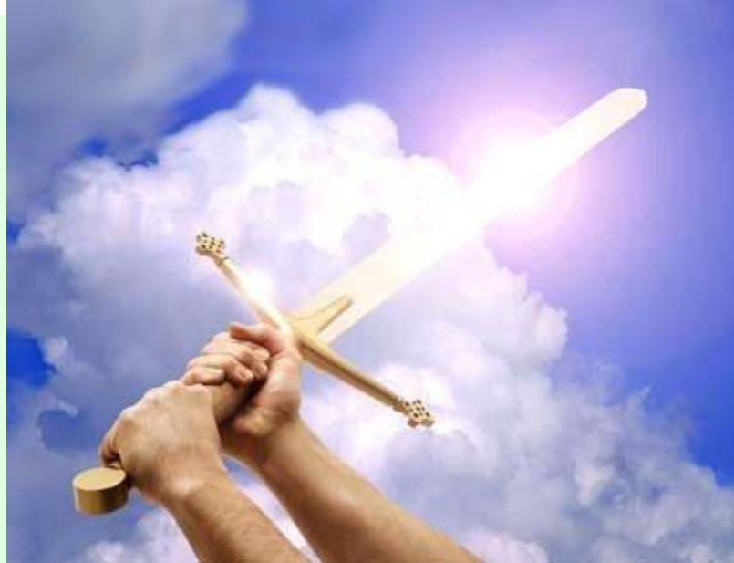
Las expectativas del pueblo judío eran que Jesús dirigiera una lucha armada contra el imperio romano.

Este fue el origen del llamado Secreto Mesianico. Tal vez pueda afirmarse que Jesús quiso únicamente ser re-